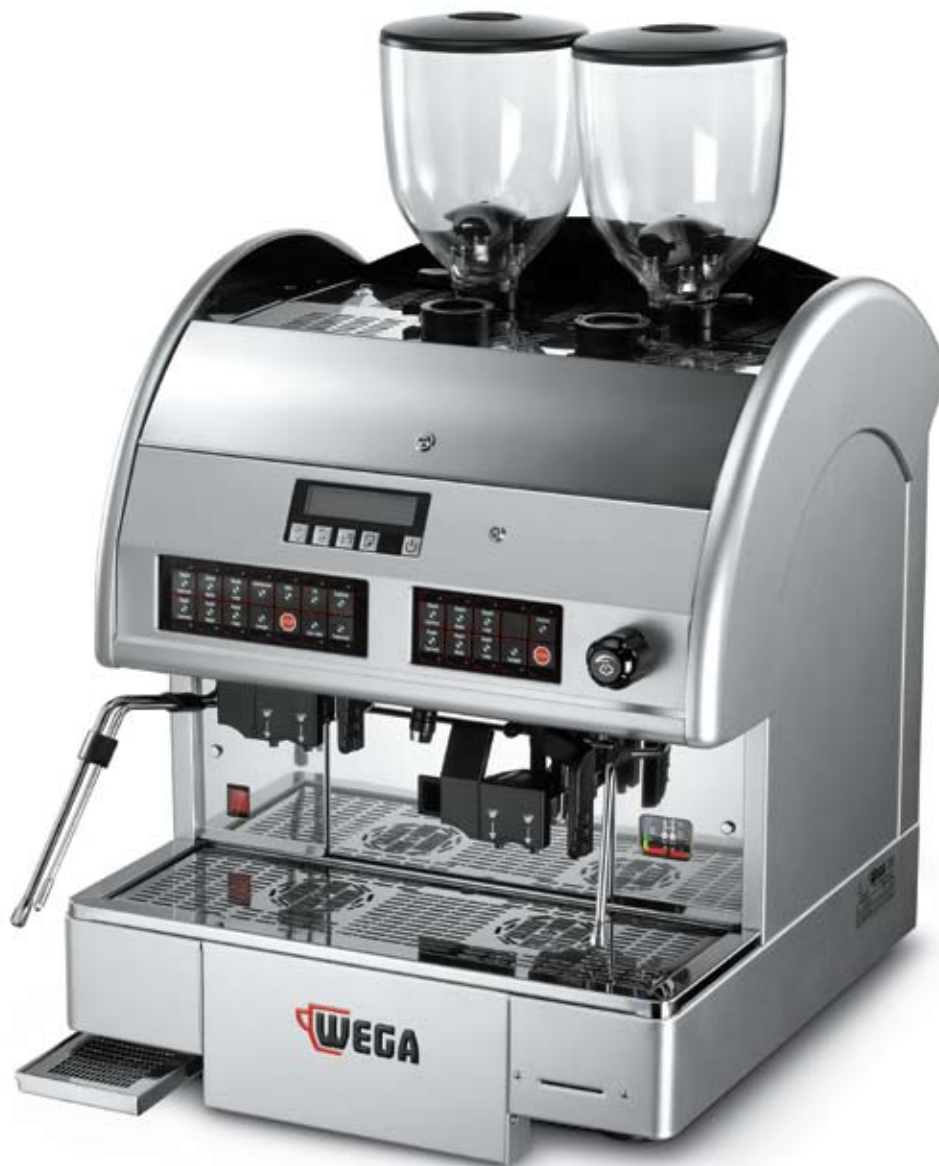
modello GEMINI con 1 cappuccinatore e autosteamer